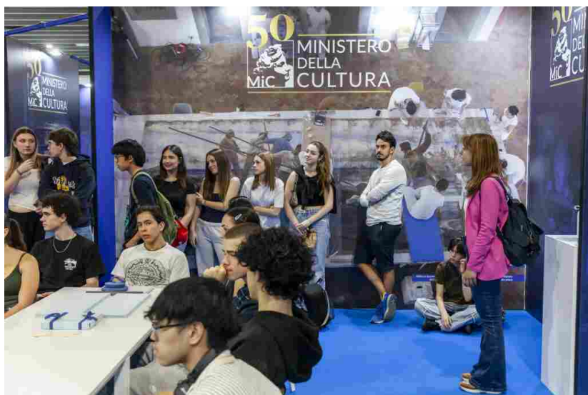
phGiacomoBrini 2025_05_15 SaloneRestauro FerraraEXPO IMG_8797 (1)

Grande spazio sarà dedicato anche all'eccellenza dell'artigianato italiano, protagonista di un racconto che mette al centro il valore del "saper fare" e le competenze altamente specializzate che rendono il Made in Italy un modello riconosciuto a livello internazionale. Tra i protagonisti dell'edizione 2026 spicca il ruolo del Ministero della Cultura, presente con una vasta area istituzionale nel padiglione 4, pensata come luogo di confronto sulle esperienze più significative maturate dagli istituti centrali e territoriali nell'ambito della tutela dei beni culturali. Il programma convegnistico promosso dal MIC sarà articolato in panel dedicati a conservazione, accessibilità, sostenibilità e innovazione, con l'obiettivo di condividere progetti e strumenti operativi per la gestione del patrimonio culturale.