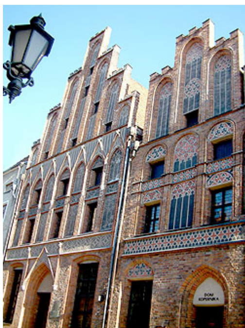
La casa di Nicola Copernico ( Miko_aj Kopernik )

Il Forum del Restauro nella scorsa edizione ha ospitato oltre 300 tra conservatori, architetti e ingegneri come espositori di lavori. Nello stesso periodo si tiene anche la Fiera Chiesa 2007 , dedicata all' arte sacra , servizi per la Chiesa , e agli oggetti sacri.